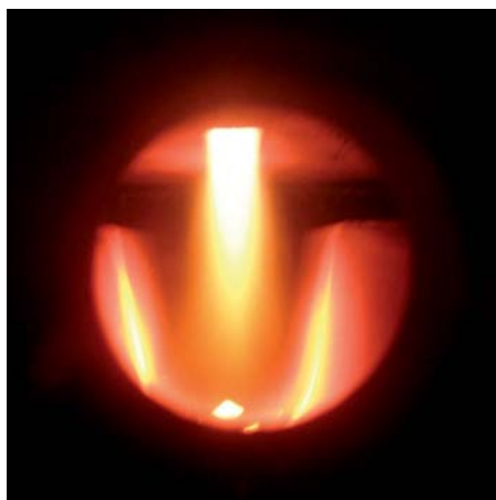
Vergasertechnik beim Vitoligno 100-S

Aufgrund der Vergasertechnik erreicht der Vitoligno 100-S einen hohen feuerungstechnischen Wirkungsgrad. Der massiv ausgeführte Füllraum aus acht Millimeter starken Stahlblechen und das zuverlässige Saugzuggebläse gewährleisten eine lange Lebensdauer.